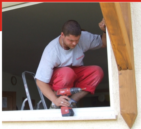
A beépített nyílászárókat eltávolítják a falnyílásból.