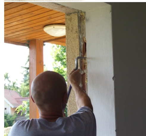
Tok kiszedése Tiszta szerelési horony kialakítása