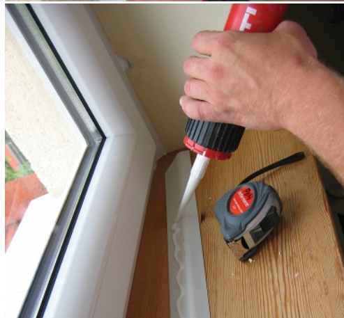
...majd a felület kezelése.