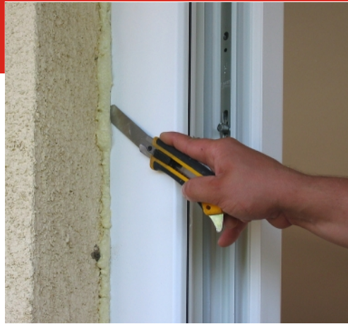
PUR hab feleslegének eltávolítása...