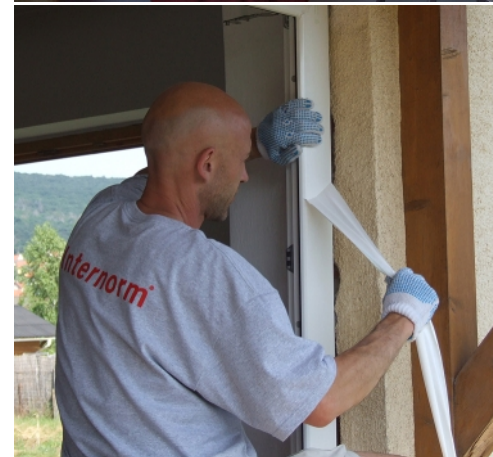
Az utolsó fázis a finombeállítás és a védőfólia eltávolítása.